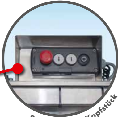
Steuerung am Kopfstück